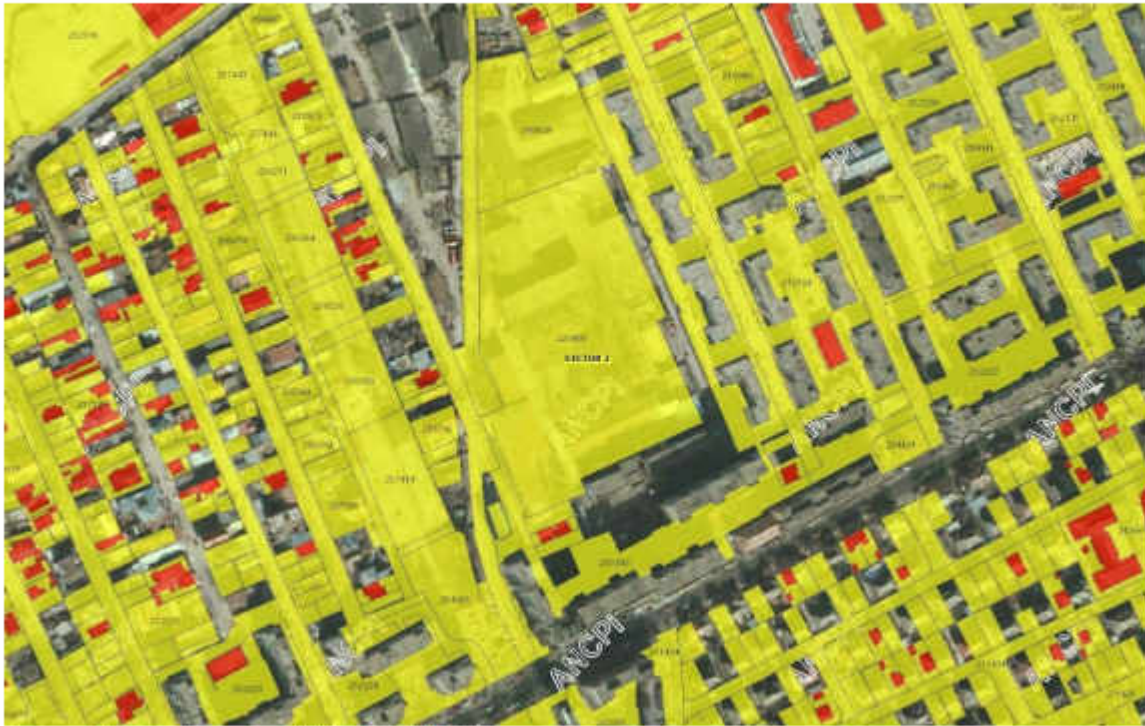
Extras din încadrare în ANCPI, imobile E-terra